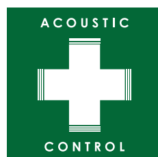
「アコースティックコントロール」テクノロジーロゴマーク

「アコースティックコントロール」とは、これまで弊社が培ってきた音響解析・補正ノウハウによってオーディオシステムの再生環境を改善し、システム本来のポテンシャルを引き出して、より良い音を実現するためのテクノロジー&コンセプトの総称です。今回の SonicPLUS スバル車専用モデルでは、アコースティックコントロールハウジング一体型トゥイーターモジュール「AC トゥイーター」に本技術を採用しています。