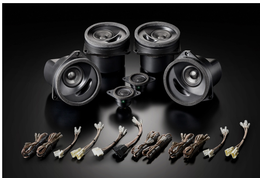
スバル WRX (VA 系) 専用スピーカーパッケージ「SX-W01M」(フロント+リアセット)

*画像はプロトタイプです。仕様や外観などの一部が実際と多少異なることがあります。