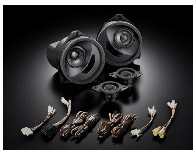
「SP-W01M」(フロント専用単品)