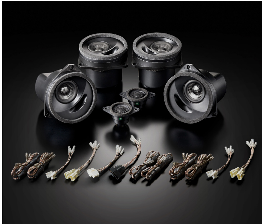
スバル 新型 WRX（VA 系）専用スピーカーパッケージ「SX-W01M」（フロント+リアセット）

株式会社ソニックデザイン（千葉県千葉市中央区南町 2-6-18、社長：佐藤敬守）は、簡単・確実な装着作業によって純正カーオーディオシステムの高音質化を実現する車種別スピーカーパッケージ「SonicPLUS」（ソニックプラス）シリーズの上級機として、スバル 新型 WRX/LEVORG（レヴォーグ）/SUBARU XV/ インプレッサ専用のハイグレードモデル 4 機種（計 12 製品）を、2014 年 10 月 2 日より全国の弊社製品認定販売店（カーオーディオ専門店、ソニックプラスセンター）で発売いたします。