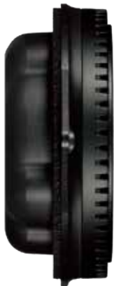
専用開発の高性能ユニットとエンクロージャが一体化されたソニックデザイン TBE-77Ji のフルレンジモジュール