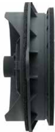
ユニット背面が解放されエンクロージャ機能のない一般的な純正 16cm スピーカー (概念説明用モデル)